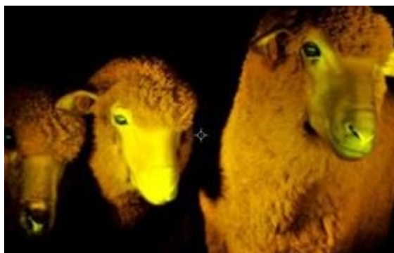
Las ovejas tratadas genéticamente se iluminan en la oscuridad.

Hasta ahora tres países latinoamericanos han comunicado el nacimiento de animales genéticamente modificados: el primero fue Argentina, con una vaca , el segundo fue Brasil, con cabras , y ahora Uruguay con ovejas .