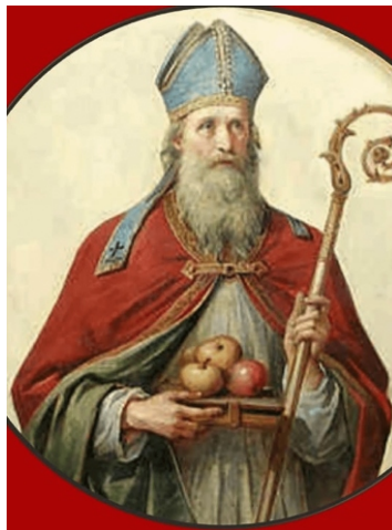
San Nicolás de Myra

Actualmente sus reliquias se conservan en Bari, Italia, porque cuando los musulmanes conquistaron territorio turco, un grupo de católicos romanos sacó de allí en secreto las reliquias del santo y se las llevó a la ciudad italiana.