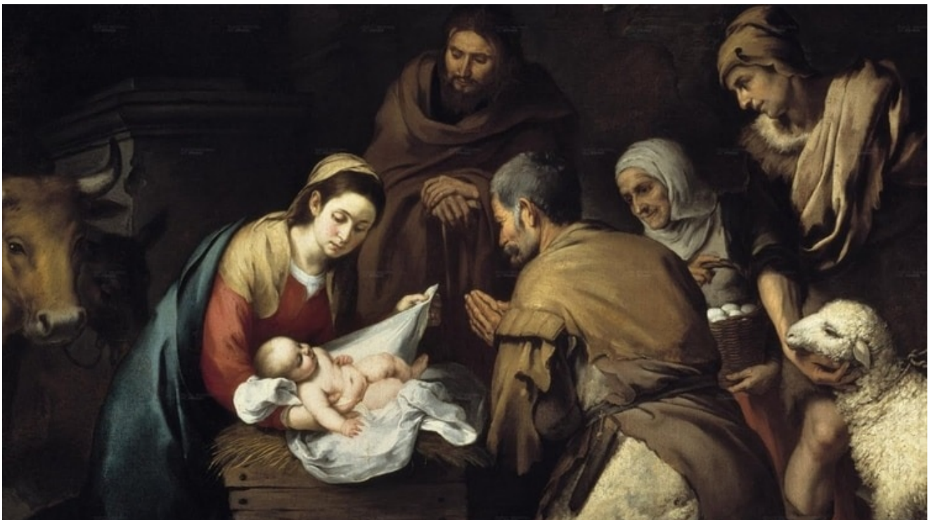
“La adoración de los pastores”, de Bartolomé Esteban Murillo, un cuadro que representa el nacimiento de Jesucristo

Tan antiguo es el festival religioso del 25 de diciembre que su origen se pierde en las profundidades del tiempo. Durante todos los milenios y siglos precedentes a Jesús, todos los considerados salvadores y redentores del mundo supuestamente nacieron en diciembre.