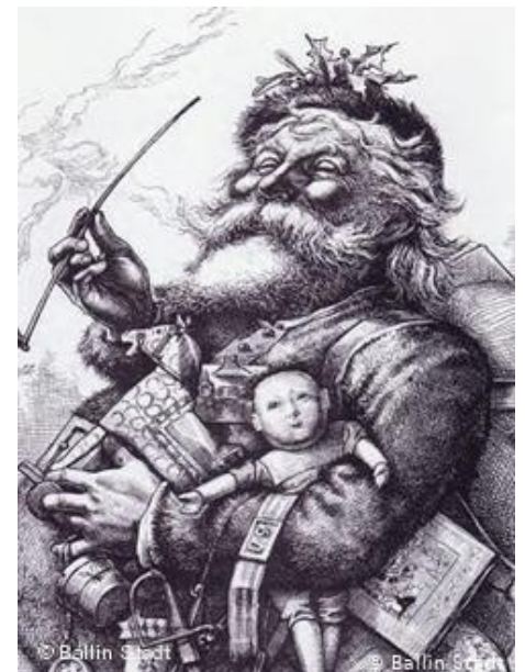
Santa Claus de Thomas Nast

En 1863 Santa Claus adopta su nueva fisionomía gracias Thomas Nast, un dibujante que diseñó al personaje para sus tiras navideñas en Harper's Weekly. Sus vestimentas nuevas tendrían influencia de los obispos de antaño y sin relación con San Nicolás de Bari.